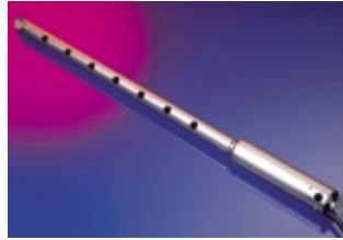
B - O 2 -Regelung