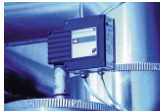
F - Niveauüberwachung

Im Laufe der Lebensdauer eines Wärmeerzeugers ist eine periodische Anpassung an den aktuellen Stand der Technik und veränderte gesetzliche Rahmenbedingungen notwendig. SAACKE bietet hierzu ein umfangreiches Programm: