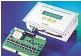
E - Erstwertstörmelder IMS