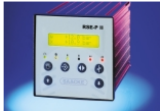
D - \mu P-Regler RSE-P II