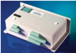
C - Feuerungsautomat