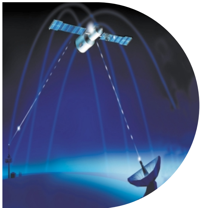
Die Ferndiagnose durch Teleservice macht die Anreise von Servicepersonal in vielen Fällen überflüssig.

Unser Service ist auf ein Ziel ausgerichtet: Die Funktion Ihrer Feuerungsanlagen über viele Jahre hinaus sicherzustellen – wirtschaftlich, umweltschonend, zuverlässig!